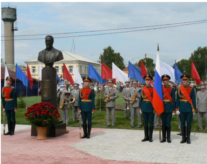
Бюст М.И.Хилкова на станции Сонково

А деревня Хонеево – родина Чудова Михаила Семеновича, советского государственного и партийного деятеля, делегата первого Всесоюзного съезда Советов, XII-XVII съездов партии. Земляки увековечили память о Михаиле Семеновиче Чудове, назвав в честь односельчанина свой колхоз.