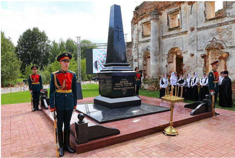
Мемориальный обелиск в деревне Горка.